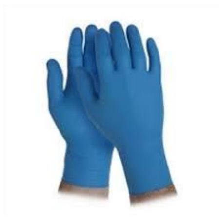
Guanti in nitrile

Inoltre, per gli alunni con disabilità certificata il Consiglio di Classe, tenuto conto delle specificità dell'alunno e del PEI, ha la facoltà di esonerare l'alunno dall'effettuazione della prova di esame in presenza, stabilendo la modalità in videoconferenza come alternativa.